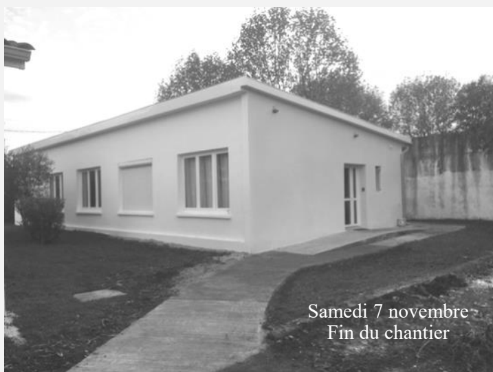
Samedi 7 novembre Fin du chantier