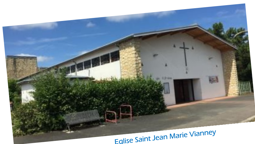
Eglise Saint Jean Marie Vianney