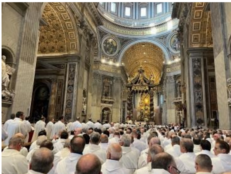
Messe du jubilé des diacres à St Pierre de Rome

Frères diacres, le travail gratuit que vous accomplissez, expression de votre consécration à la charité du Christ, est pour vous la première annonce de la Parole, source de confiance et de joie pour ceux qui vous rencontrent. Accompagnez-le le plus possible avec le sourire, sans vous plaindre ni chercher la reconnaissance, en vous soutenant mutuellement, même dans vos relations avec les évêques et les prêtres, « comme expression d'une Église engagée à grandir dans le service du Royaume avec la valorisation de tous les degrés du ministère ordonné » (C.E.I., I Diaconi permanenti nella Chiesa in Italia. Orientamenti e norme, 1993, p. 55). Votre action concertée et généreuse sera ainsi un pont qui reliera l'Autel à la rue, l'Eucharistie à la vie quotidienne des gens. La charité sera votre plus belle liturgie et la liturgie votre plus humble service.